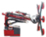
UPM 625 Seite 22