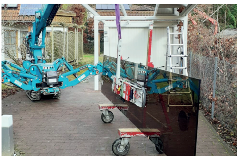
Nutzen Sie den UPT800, um die Elemente auf der Baustelle zu transportieren