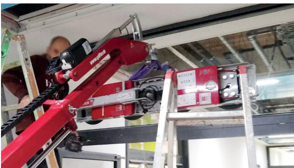
Durch die leichte, kompakte Bauweise sind besonders flexible Einsatzmöglichkeiten gewährleistet