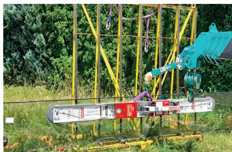
Mit einer Länge von 2,16 m ist der UPG 450 ideal für lange, schlanke Elemente geeignet