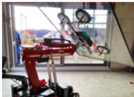
Manuelles Kippen, Schwenken und Drehen